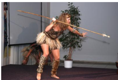
Taneční skupina EQUET - africké tance

Před vystoupením dívčí taneční skupiny EQUET, která večer zpřijemnila cikánskými a africkými tanci, představil moderátor Jan Pokorný pět exponátů, které byly odbornou porotou a zástupci mediálních partnerů nominovány na speciální cenu pro best-of-the best exponát.