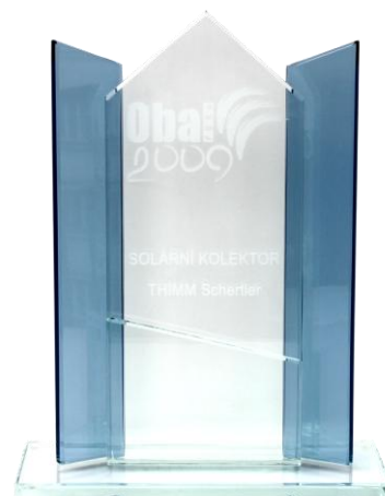
CENA PŘEDSEDKYNĚ KOMISE 2009: THIMM SCHERTLER - SOLÁRNÍ KOLEKTOR